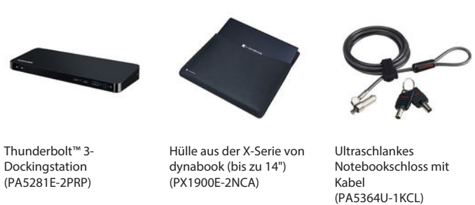
Thunderbolt™ 3-Dockingstation (PA5281E-2PRP)