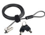
Ultraschlankes Notebookschloss mit Kabel - dynabook (PA5364U-1KCL)