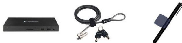
dynabook USB-C™-Dockingstation (PA5356E-1PRP)